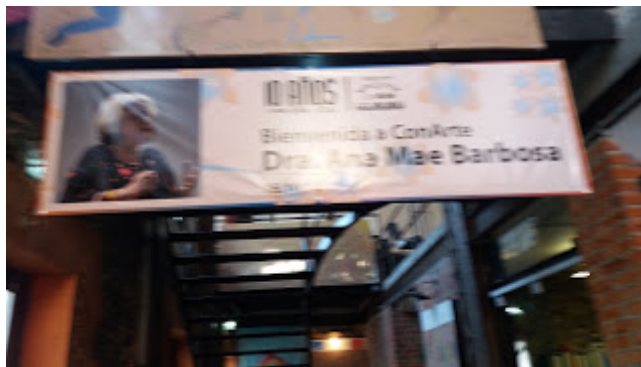
Faixa de recepção para Ana Mae Barbosa